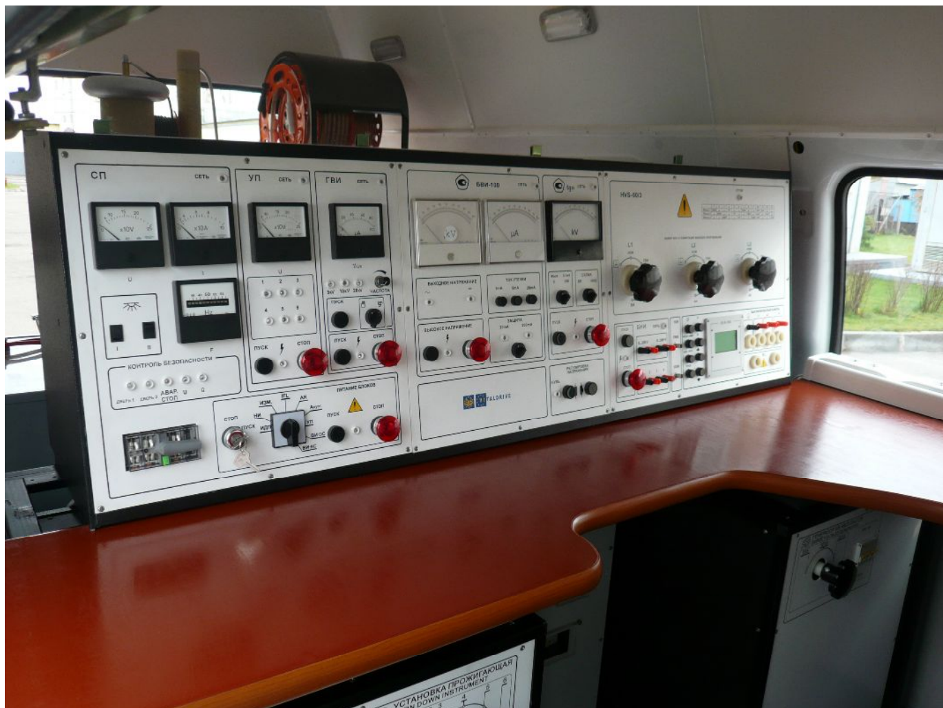
Вид на пульт управления в отсеке оператора кабельной лаборатории ЛВИ НVT-35FV

пеналы для хранения инструмента и приспособлений, необходимых в работе. Основное оборудование установлено и закреплено на раме. Кабель уложен в специальных кабельных каналах.