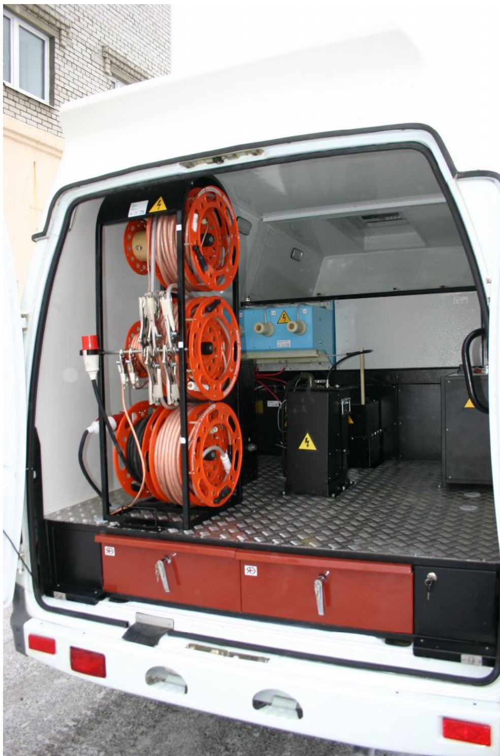
Вид на высоковольтный отсек кабельной лаборатории ЛВИ НVT-35FV

Лаборатория имеет следующие основные отличительные особенности: